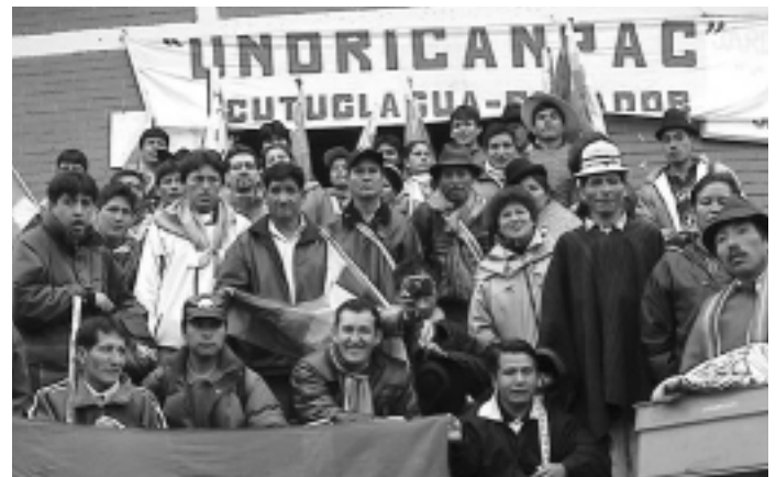
Delegación de Bolivia que participó en las Jornadas de Reflexión y Resistencia al ALCA realizadas a fines de Octubre del 2.002 en Quito Ecuador

NUESTRA AMÉRICA NO ESTÁ EN VENTA! ¡SOBERANÍA POPULAR SÍ, ALCA NO! HAGAMOS JUNTOS OTRA AMÉRICA POSIBLE!