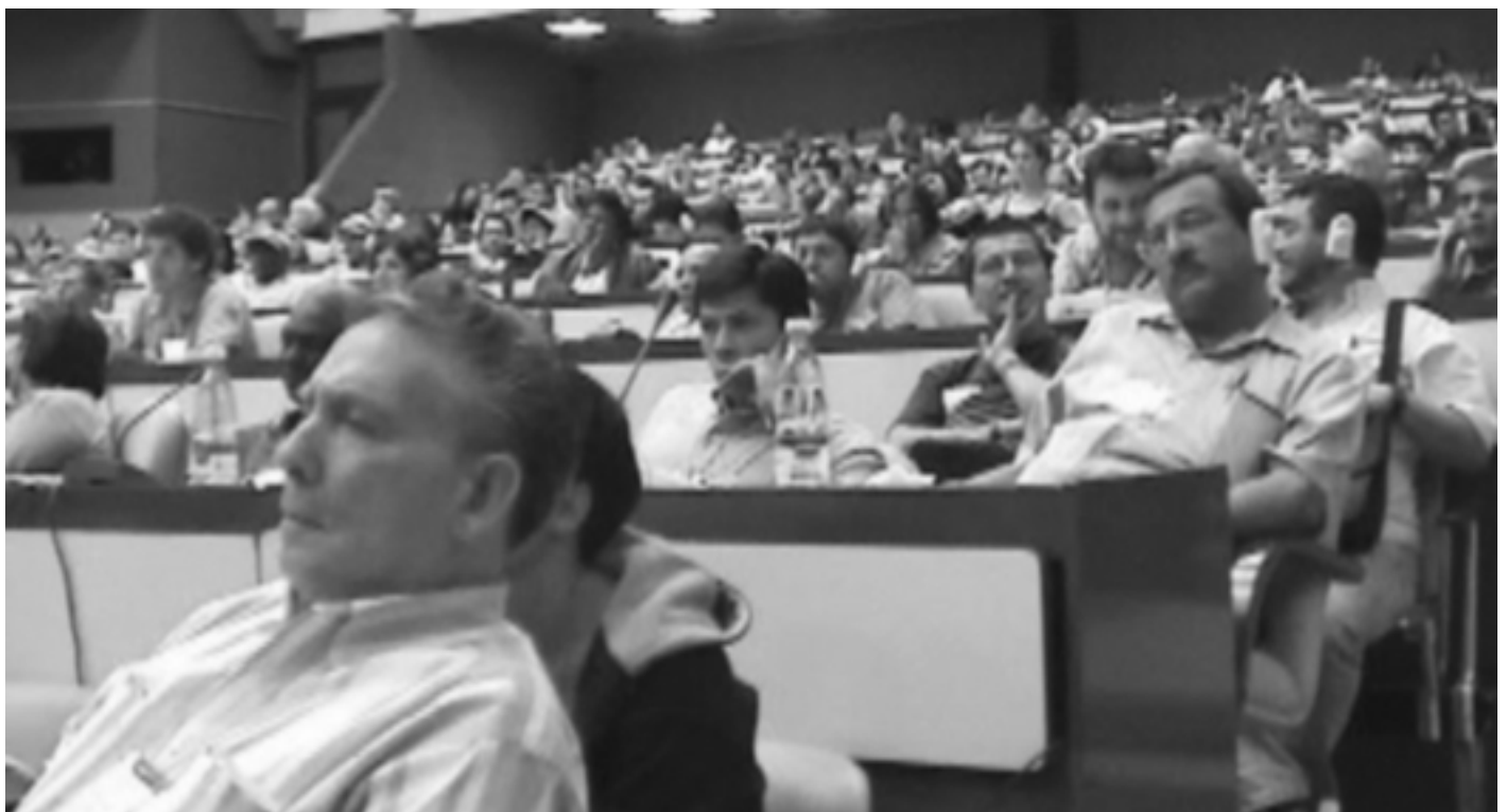
Segundo Encuentro Hemisférico de Lucha contra el ALCA

15) Dosificar los eventos continentales para concentrar energías. Los eventos definidos e insoslayables que involucran un despliegue continental de la campaña contra el ALCA y que están bajo nuestra responsabilidad son: a) la participación en el FSM-enero 2.003, b) la Cumbre de la OMC-septiembre 2.003, c) la reunión de Ministros del ALCA en Miami fines del 2.003 y d) el III Encuentro Hemisférico de lucha contra el ALCA de la Habana-13 al 18 de enero 2.004. En cuanto a la Cumbre de los Pueblos de América a realizar en Argentina-Abril 2.003 y el FSM-hemisférico de Ecuador-Octubre 2.003, se analizará durante el FSM las características y pertinencia de asumir a nivel continental estos eventos en función del cronograma oficial y de eventos alternativos que se vayan definiendo.