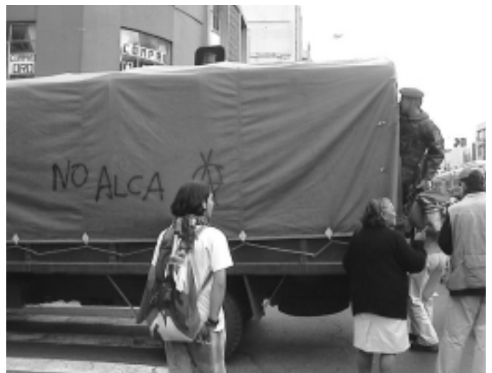
Octubre 2.002, Quito, Ecuador