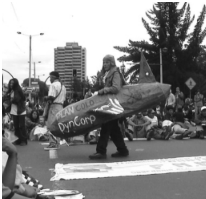
Octubre 2.002, Quito, Ecuador

en todos los países. La consulta iniciada en Brasil y que ahora se desarrolla en México, Québec y Canadá es una de nuestras principales herramientas para informar, movilizar a millones de personas y sentar las bases de la legitimidad democrática de nuestra campaña. La Consulta Continental debe ser concretada en todos los países extendiendo el plazo de la realización de la misma hasta octubre del 2.003. Cada comité nacional debe precisar las fechas de realización de la Consulta Popular en su país. Los resultados de la Consulta a nivel Continental serán presentados en el marco de jornadas de resistencia en todos nuestros países durante la Reunión de Ministros de Miami a fines del 2.003.